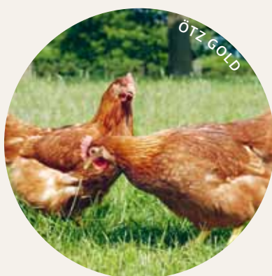
ÖTZ GOLD UND SILBER LEGEHENNE UND BRUDERHAHN