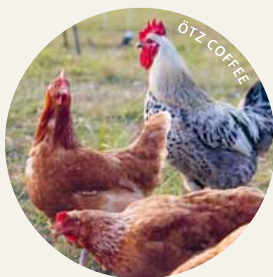
ÖTZ COFFEE UND CREAM ZWEINUTZUNG

HINWEIS: Der Kauf von Junghennen ohne Hahnenprodukte ist nicht möglich.