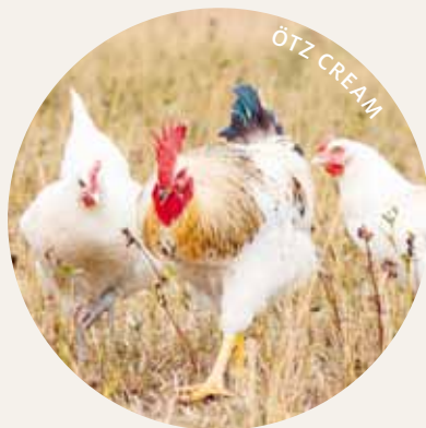
ÖTZ COFFEE UND CREAM

Eier pro Jahr: 200–230 Eigröße: Überwiegend M Schalenfarbe: Hellbraun / Beige / Bunt Legebeginn: LW 20 Lebendgewicht bei Legebeginn: 2,1–2,3 kg Futtermittelverbrauch bei 100% Biofutter: 135–145 g Schlachtgewicht der Hähne 16. LW: 1,4–1,6 kg