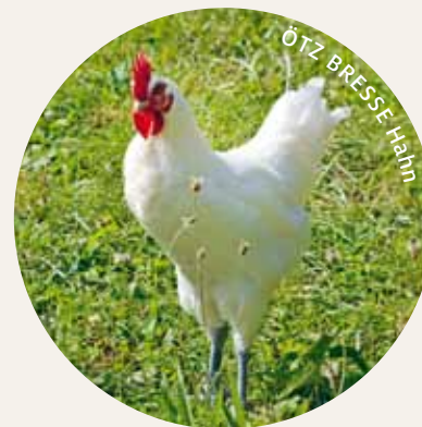
ÖTZ BRESSE* GAULOISES

Eier pro Jahr: 230–250 Eigröße: Überwiegend M, L, XL Schalenfarbe: Hellbraun Legebeginn: LW 19–20 Lebendgewicht bei Legebeginn: 1,7–1,8 kg Futtermittelverbrauch bei 100% Biofutter: 135–145 g Schlachtgewicht der Hähne 20. LW: 1,7–1,8 kg