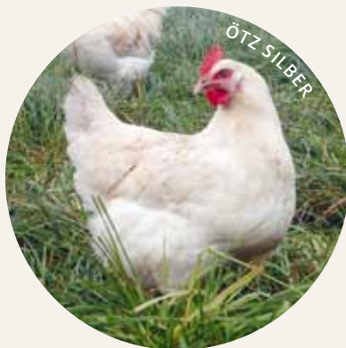
ÖTZ GOLD UND SILBER

Eier pro Jahr: 200–230 Eigröße: Überwiegend M Schalenfarbe: Hellbraun / Beige / Bunt Legebeginn: LW 20 Lebendgewicht bei Legebeginn: 2,1–2,3 kg Futtermittelverbrauch bei 100% Biofutter: 135–145 g Schlachtgewicht der Hähne 16. LW: 1,4–1,6 kg