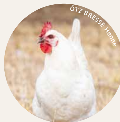
ÖTZ BRESSE* GAULOISES MAST- UND ZWEINUTZUNG